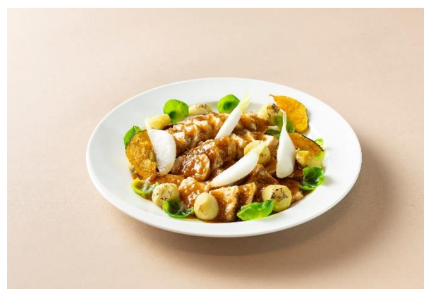
神戸ポークと栗煮込み