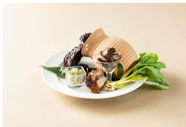
須磨の蛸の柔らか煮 とろろ昆布