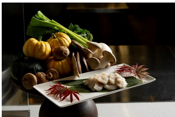
【ライブキッチン】坊勢名残鱧のしゃぶしゃぶ