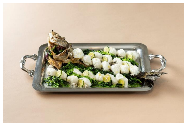
瀬戸内鱸のヴァプール 酢橘のかおり