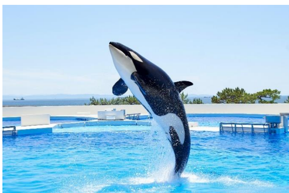
オルカパフォーマンス

※周辺の駐車場が混雑する場合がございます。公共交通機関でのご来館にご協力ください。