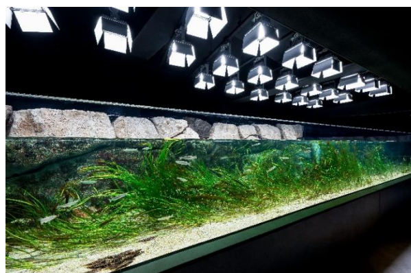
アクアライブ ローカルライフ