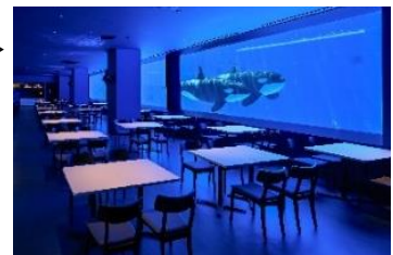
ブルーオーシャン オルカスタジアム