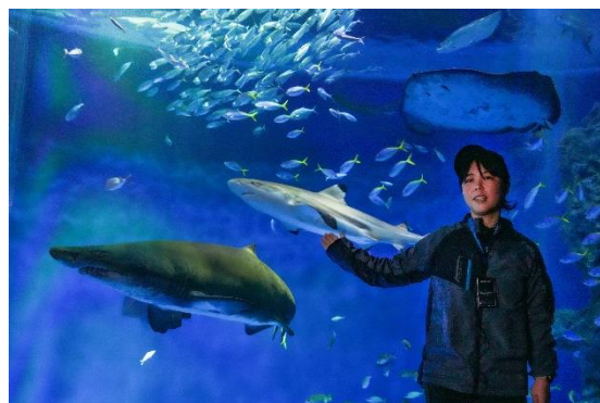
サメを観察してみよう！

「生きものスマシースクール」は、子どもたちに大人気のイルカやサメについて詳しく学べる小学生を対象とした教育プログラムです。イルカトレーナーの解説を聞きながら今年の2月に誕生したバンドウイルカの赤ちゃんを近くで観察できるほか、遊泳するサメや水槽の底でじっとしているサメの特徴を観察して、それぞれの違いを標本や解説を通じて学ぶことができます。さらに、プログラムの終わりには透明なうちわに生きものの絵を描く工作を実施し、プログラムで学んだことをお土産としてお持ち帰りいただけます。