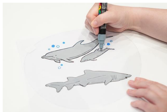
工作「オリジナルうちわ作り」