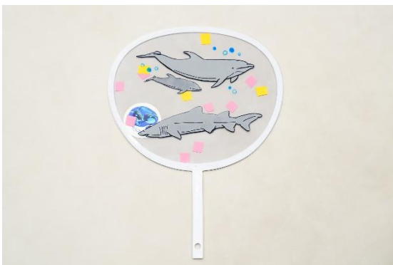
オリジナルうちわ 完成イメージ