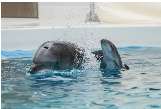
バンドウイルカの親子を観察

内容 : ①レクチャー「イルカやサメについて学んでみよう！」 ②バンドウイルカの親子を観察 ③サメを観察 ④おさらいと工作「オリジナルうちわ作り」